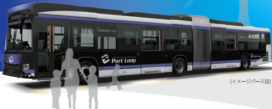
[イメージパース図]